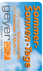
Kombinierte Werbeaktion: Postkarte plus Gratis Werbe T-Shirts